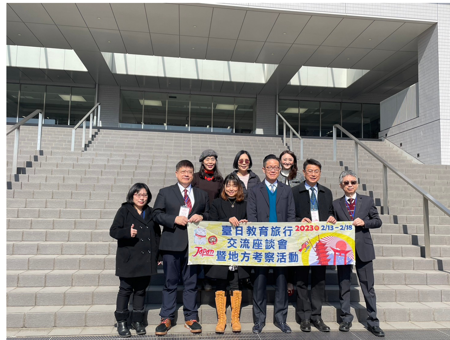
長野縣千曲市屋代高等學校