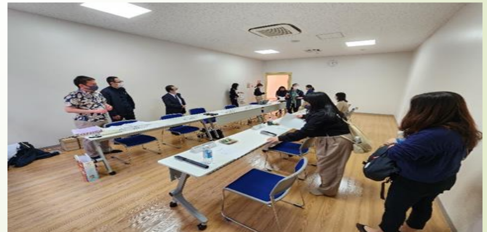
圖 30、與沖繩觀光局座談會