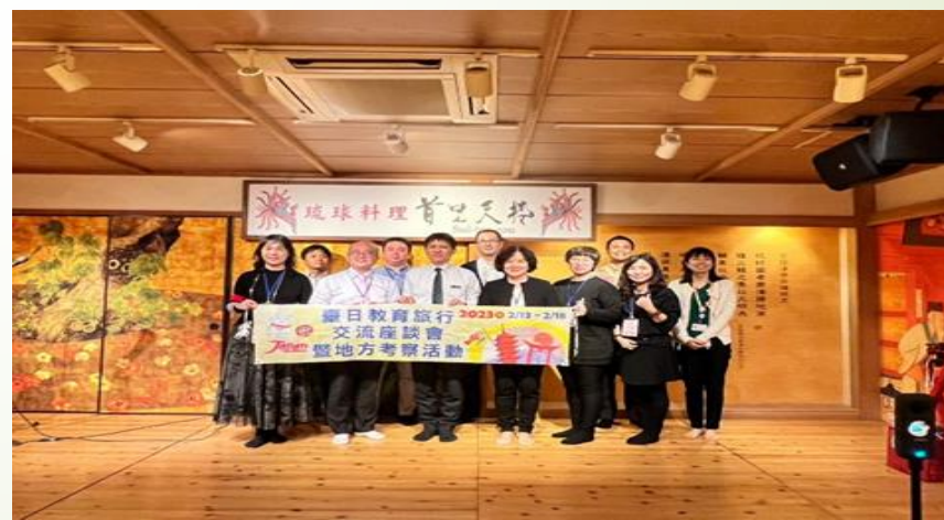
圖 4、團員與沖繩觀光廳教育處合影