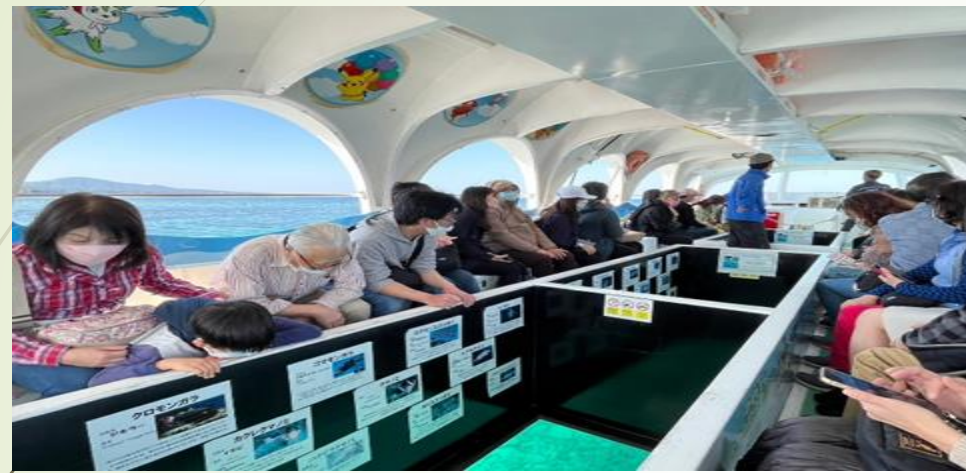
圖 25、搭乘玻璃船觀賞海底珊瑚與生物

第五天：布聖納海中公園(玻璃船、海中展望塔)→御菓子御殿紅薯蛋塔製作體驗→沖繩空手道會館(參觀資料館、空手道體驗)→意見交流會