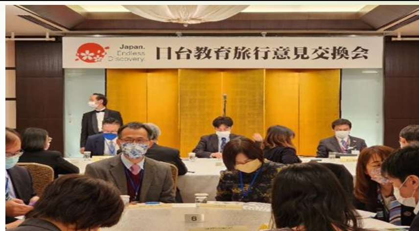
圖 2、日台教育旅行意見交換會