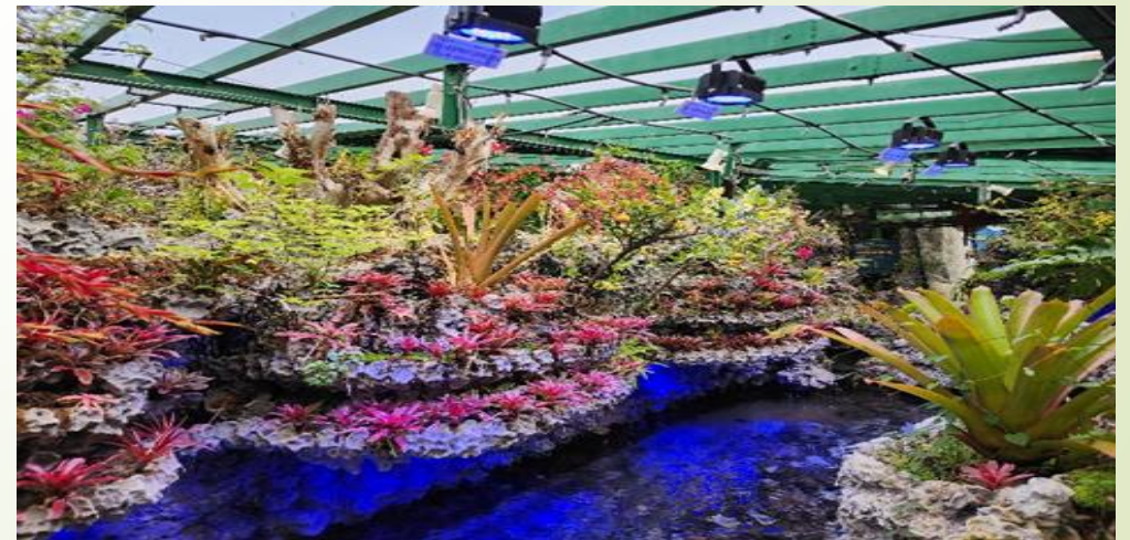
圖 4、珊瑚育苗成果珊瑚育苗體驗