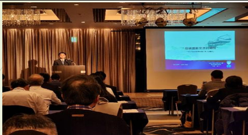
圖 1、專題演講「疫後重啟交流的期待」

第二天：臺日教育旅行交流座談會→羽田機場國內線→那霸機場→首里天樓晚宴 (歡迎會場)→南西觀光飯店