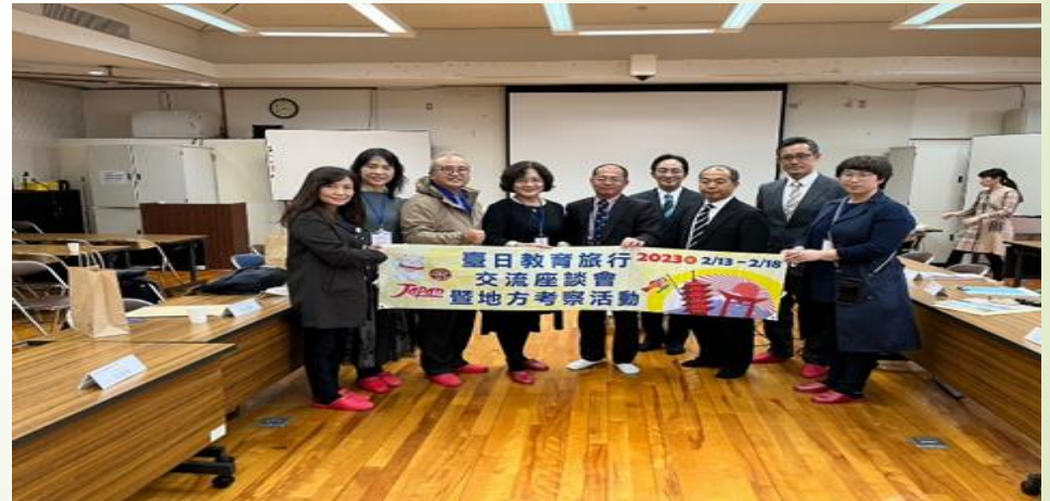
圖 4、參訪沖繩縣立向陽高中