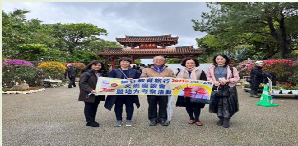
圖 1、首里城公園守禮門前合影

第三天：首里城公園→沖繩世界文化工國、玉泉洞→參訪沖繩縣立向陽高中→平和祈念公園→沖繩喜璃癒志海灘渡假飯店