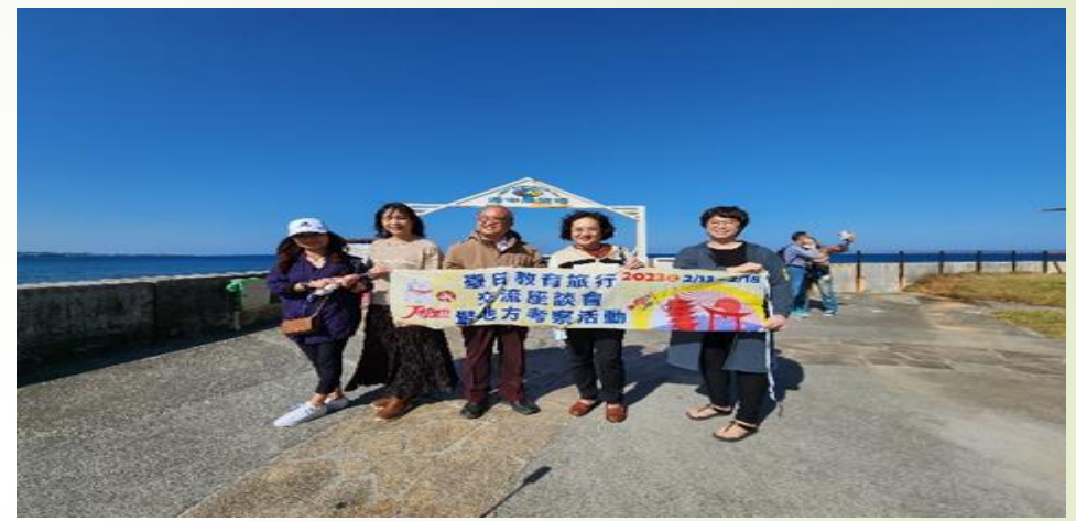
圖 26、海中展望台入口處合影