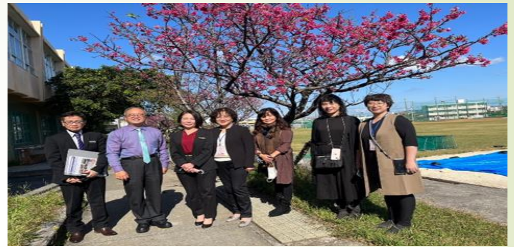
圖 2、具志川商業高中校園球場櫻花盛開