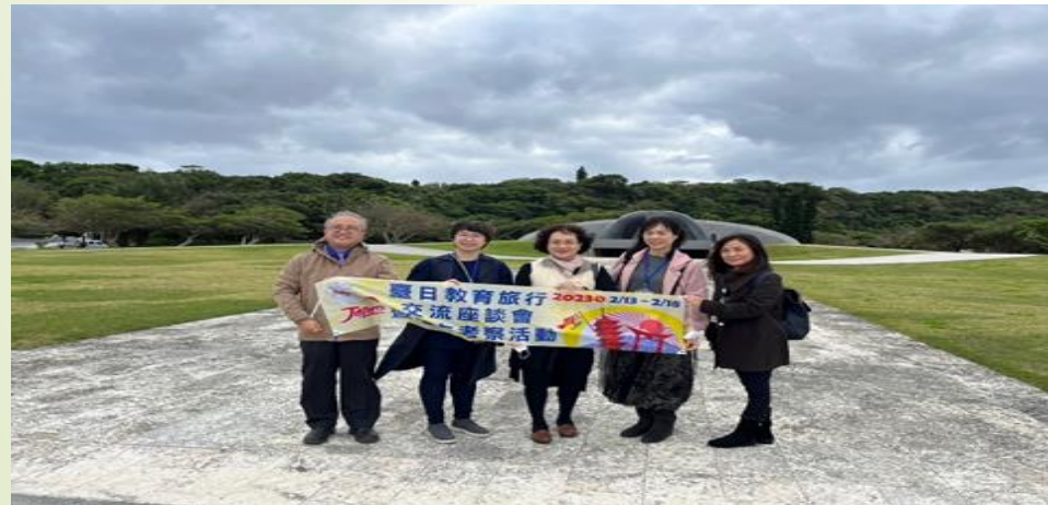
圖 3、平和祈念公園廣場