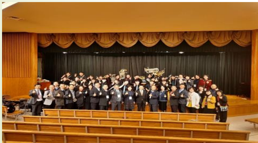
圖 3、光英高中學生樂團社團表演