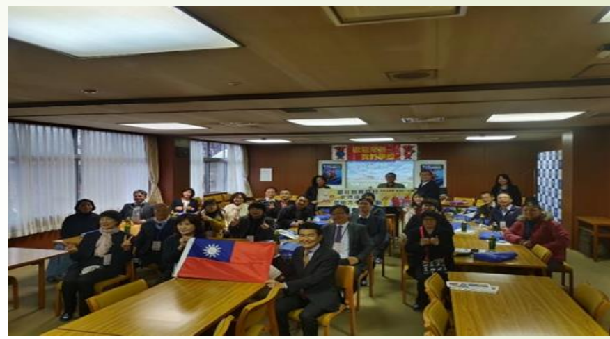
圖 2、參訪千葉縣光英 VERITAS 高等學校