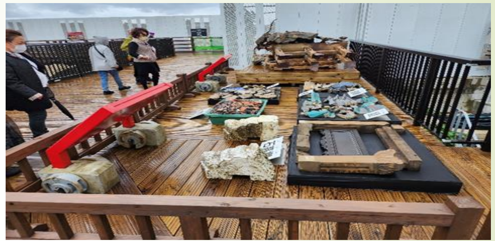
圖 2、首里城燒毀部分遺跡