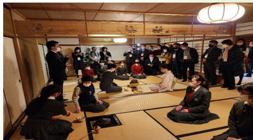
圖 4、光英高中學生茶道社團表演