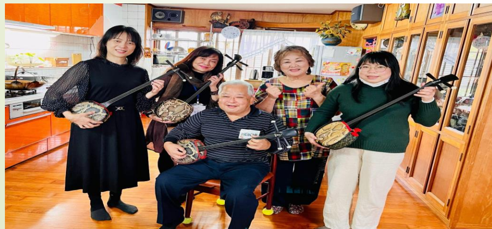
圖 3、讀谷村民家體驗