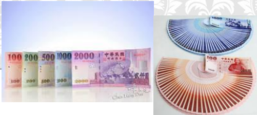
侯錦鳳 老師 編製