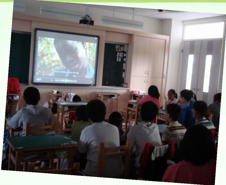
觀看影片 【烏干達的天空下】