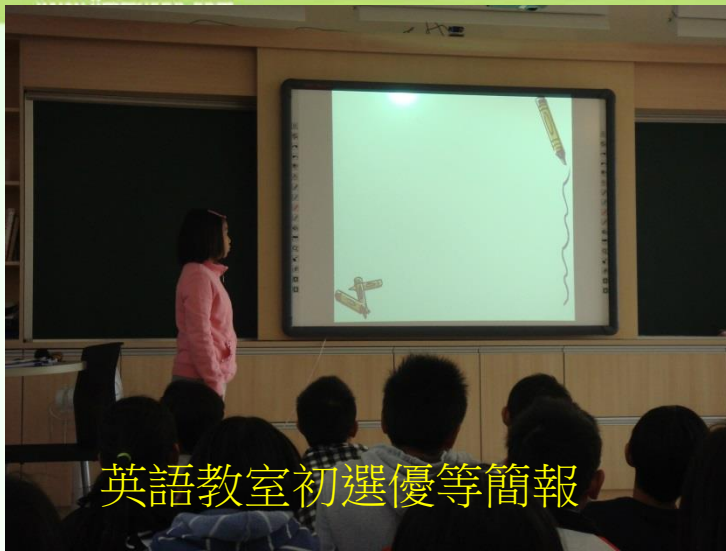
英語教室初選優等簡報