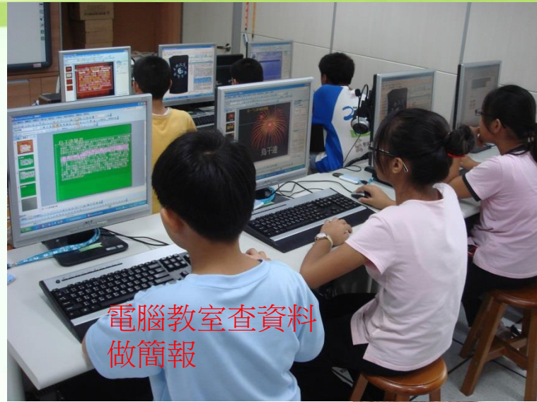
電腦教室查資料 做簡報