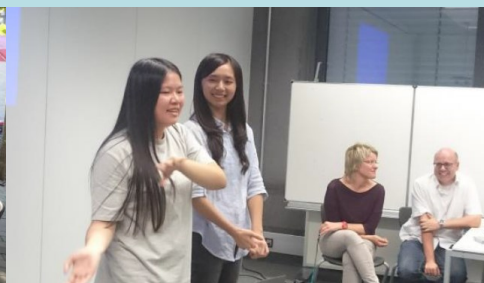
歡送會與學生成果分享