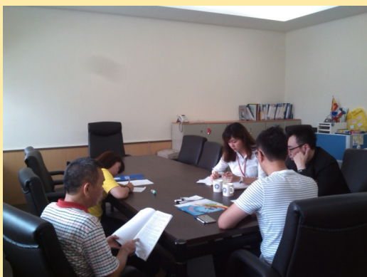
教師社群討論規劃