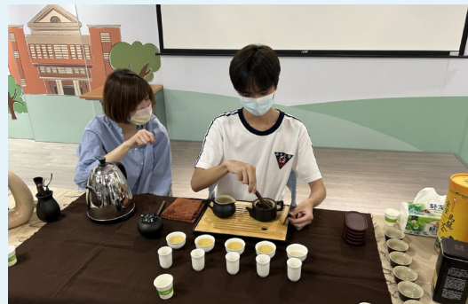
臺灣茶席學習與操作