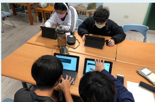
跨文化對比的小組共作