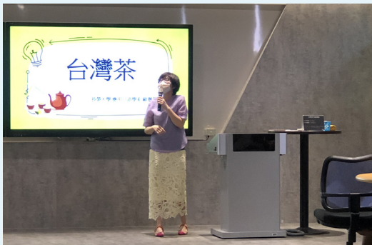
茶文化的發展探究