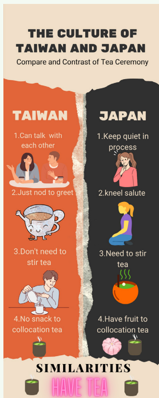
小組使用視覺化資訊圖表呈現差異