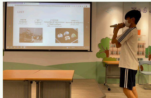
以小組報告的方式分享文化差異觀察