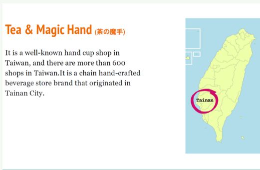
學生以調查本土市場的飲茶風氣