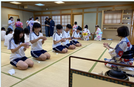
日本茶席學習與操作