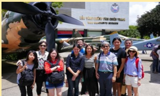
胡志明市戰爭博物館