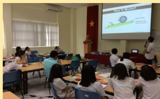
專題研究報告分享