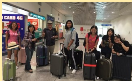
抵達胡志明市機場