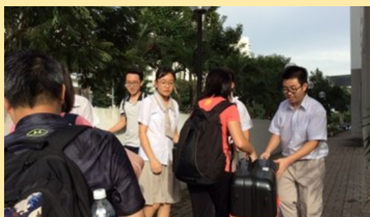
抵達丁善理紀念學校