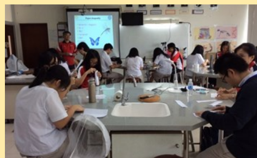
科學探究實作活動