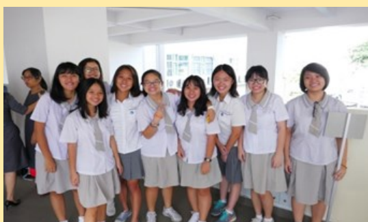
與丁善理學校同學合影