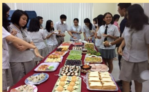
丁善理紀念學校晚宴