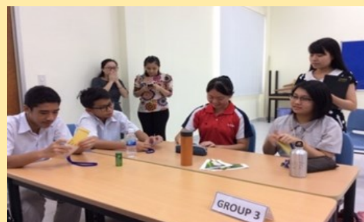
破冰活動-認識朋友