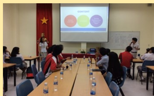
丁善理紀念中學介紹