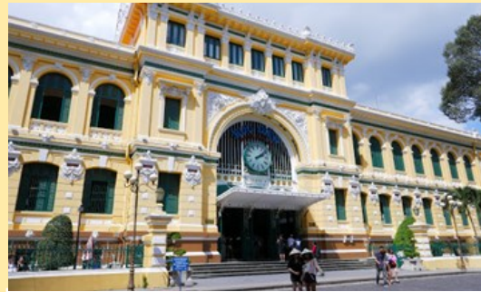
胡志明市百年郵局