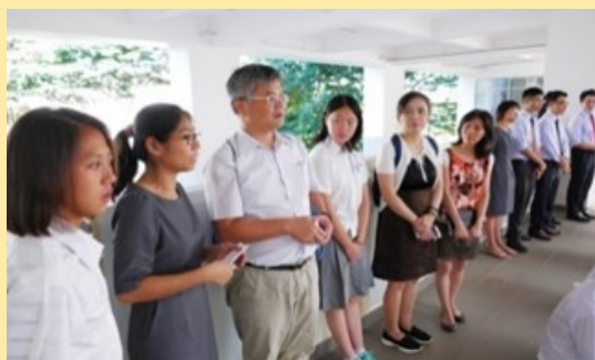
參加丁善理紀念學校朝會