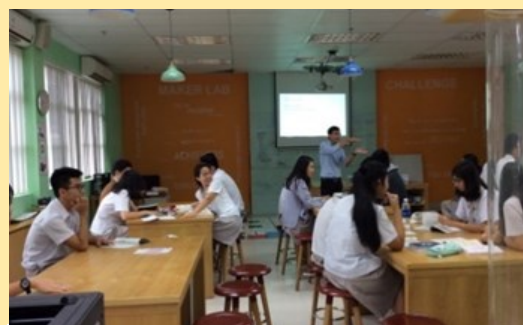
校園參觀-創客實驗室