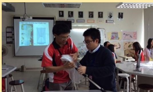
科學探究實作活動