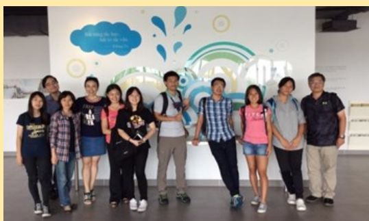
參觀丁善理基金會