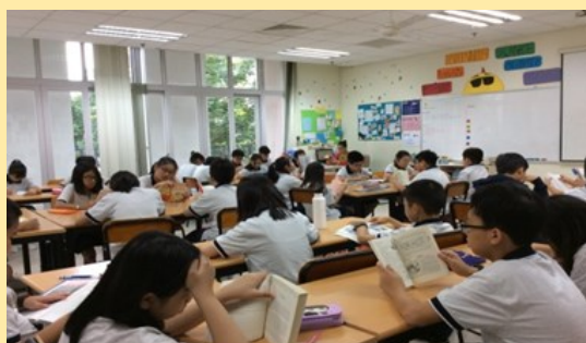
校園參觀-晨讀時間