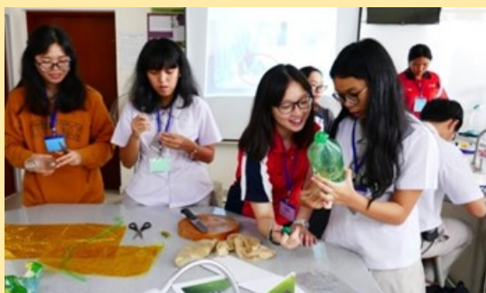
科學探究實作活動