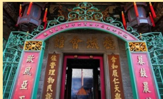
胡志明市穗城會館