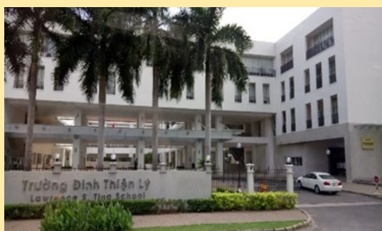
丁善理紀念中學校門