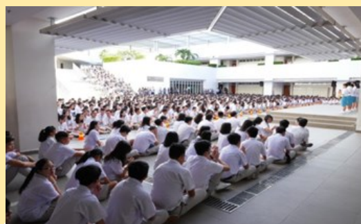
參加丁善理紀念學校朝會