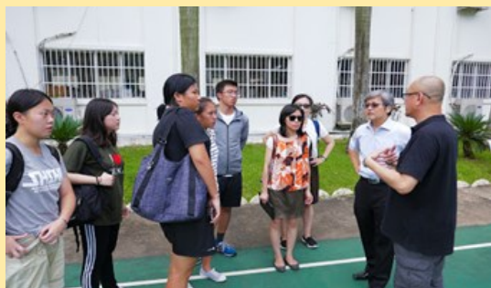
胡志明市台灣學校介紹