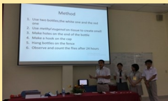
科學學習活動分組報告