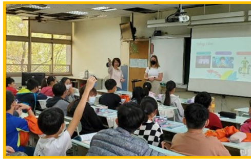
外師以簡報介紹自己的家鄉，學生也能跟外師進行互動。