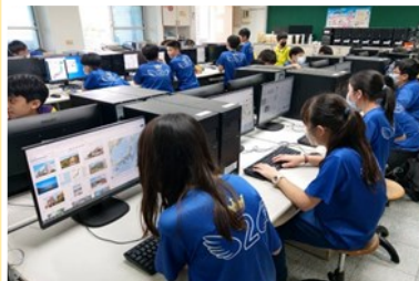
學生透過網路進行虛擬互動學習