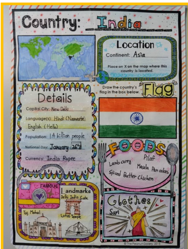
說明：學生完成老師製作的學習單，分組蒐集資料，並分工準備錄製影片。