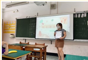
學生依校內國際教育課程設計參與教學活動