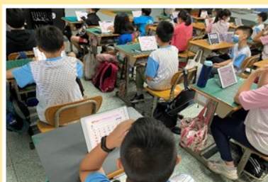
學生與中師進行不同的學習方式，課程以不同的方式呈現，讓學生能兼顧聽說讀寫。