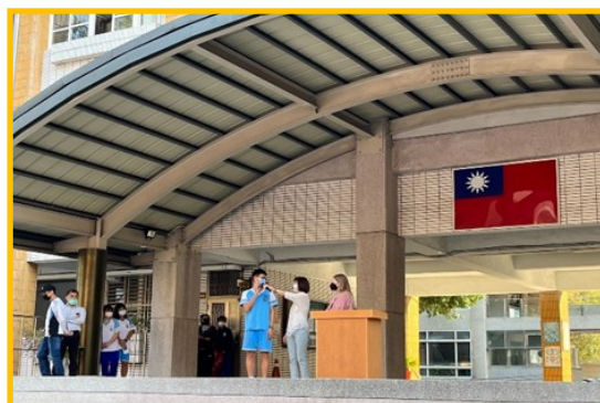
說明：朝會接待家庭學生分享。