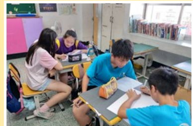
學生依課程自行進行紙本評量