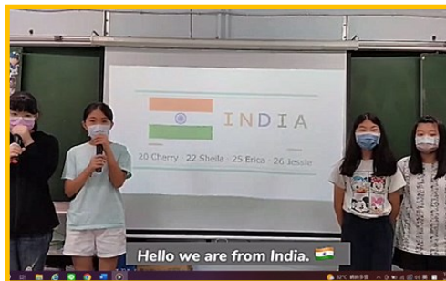
說明：學生寫稿並完成影片錄製，自行加上字幕。（抖英電台影片的製作）