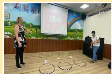
學生學習成果以多元評量方式進行