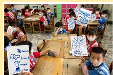
學生學習評量，變得更有彈性。