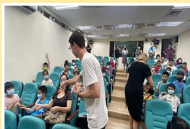
增加國定課程外其他生活化教學