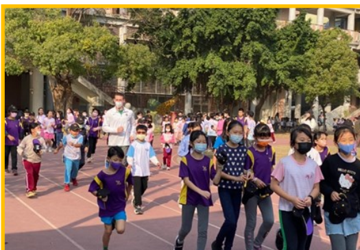
說明：外師參與學校課間晨跑活動。