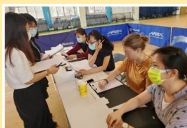
提升校內英語歌唱比賽及相關活動的學習能力。