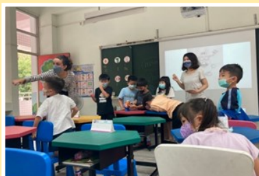
學生與外師進行面對面的實際互動