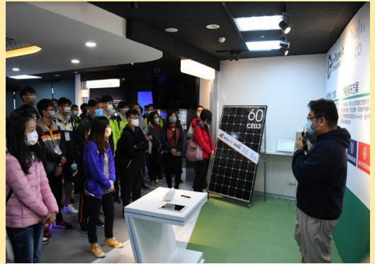
企業文化講座暨參訪情境英語