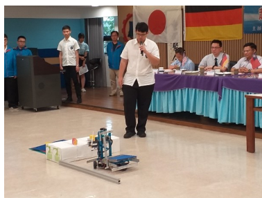
學生發表於交流時製作之成品