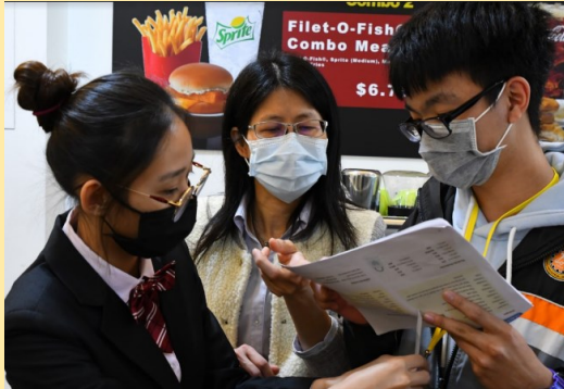
學生實際至餐廳演練如何用英文點餐