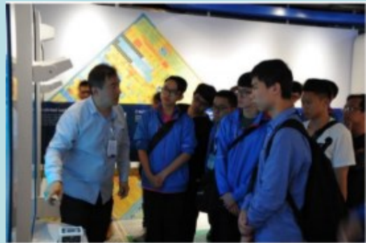
Intel Museum 導覽人員解說