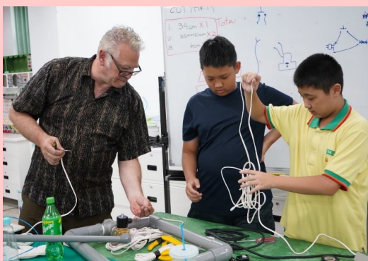
邀請Metro ED老師至本校交流