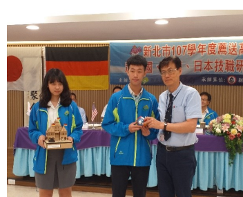
學生發表優異，上台領獎