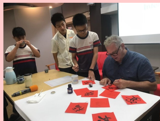
外師體驗春聯文化