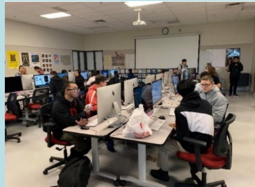
在Metro ED學生製作期末專題