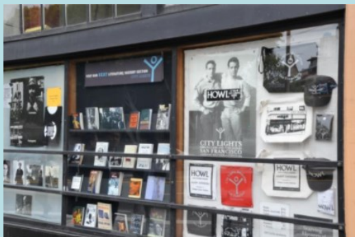
舊金山科學探索館內應用圖書