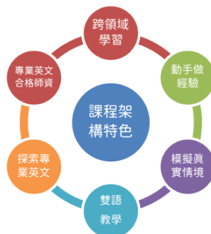
圖 1 課程架構六大特色

課程理念，本課程設計主張，係以學生赴海外學習所需面臨的情境為設計核心，課程架構概有六大特色，如圖 1 所示。