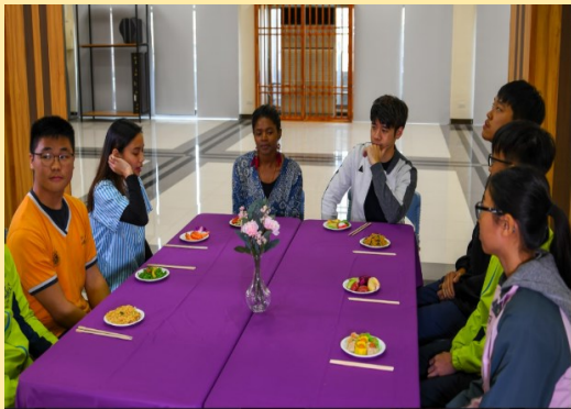
中、外師與學生模擬餐敘社交對談