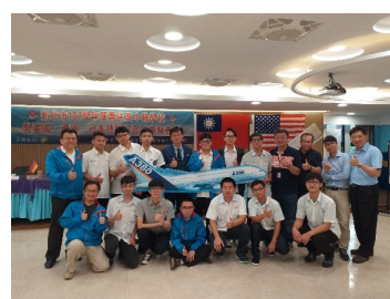
赴國外交流成果發表會合影