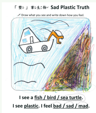
學生畫出一艘塑膠垃圾捕撈船，希望能把充滿塑膠的海洋變乾淨，不讓海龜再受傷。