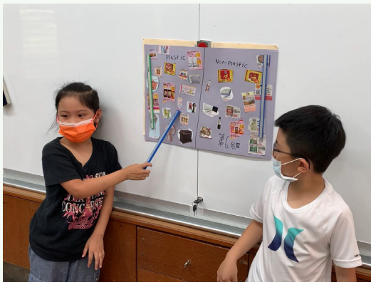
學生以雙語發表塑膠製品與非塑膠製品分類記錄結果。