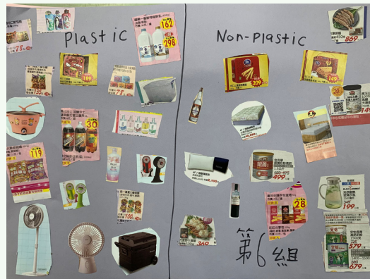
學生以剪報記錄塑膠製品與非塑膠製品分類結果。