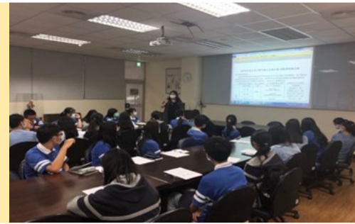
全球議題/SDG的認知與行動(2020/11/05)

為學生架接先備知識，一則強化對自己文化的認知及歷史覺知。一則認識美國地理位置與全球發展關係、中美關係的發展歷程、並探討族群議題與國際競合模式