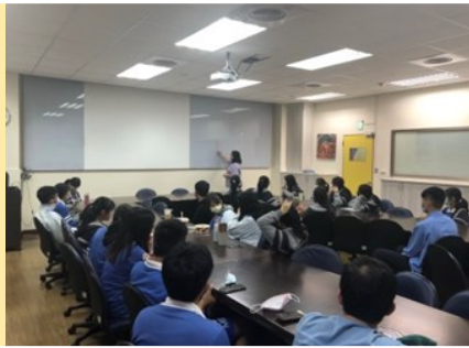
認識台灣、入境問俗(2020/10/20)

為學生架接先備知識，一則強化對自己文化的認知及歷史覺知。一則認識美國地理位置與全球發展關係、中美關係的發展歷程、並探討族群議題與國際競合模式