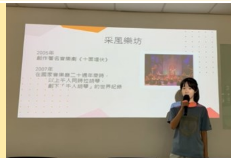
SDGs全球議題小組共學——如何確保公平的優質教育(2020/12/15)