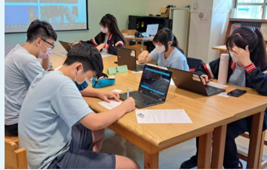
學生依據國際特赦組織的個案進行寫信馬拉松