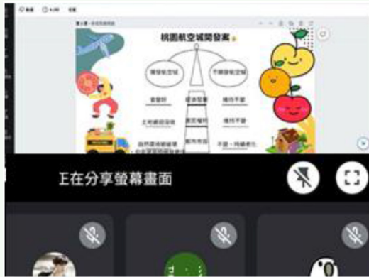
學生以權橫秤圖分析國內人權爭議案件