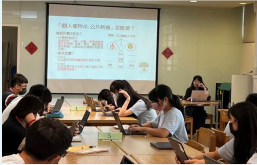
教師介紹權衡秤圖於國內爭議案件的應用方法