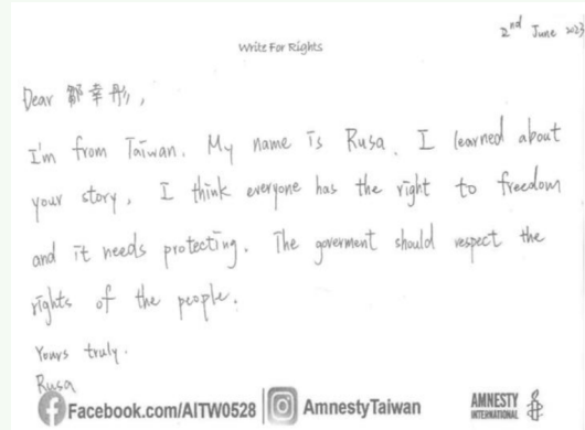
學生以英文分享寫信馬拉松書信內容