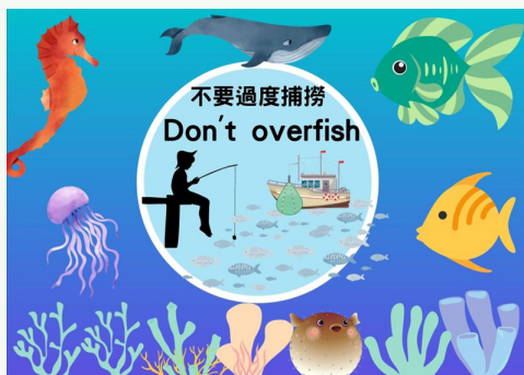
學生設計自己的 SDGs Logo