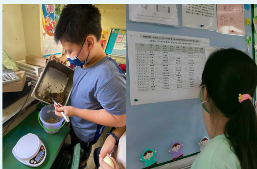
學生在班上實作廚餘堆肥