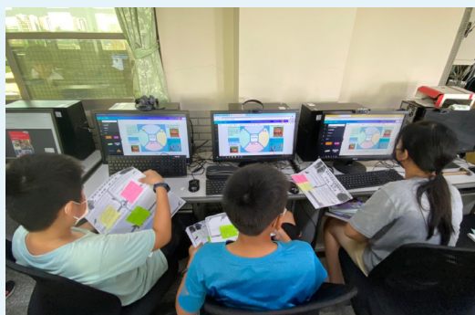
根據自評與互評修正自己的剩食分析