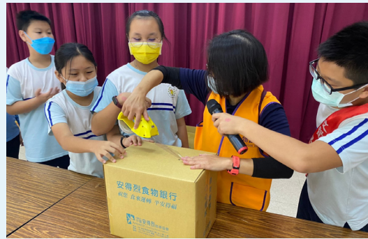
學生體驗包裝食物箱