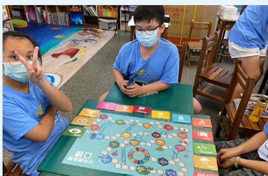
透過 Go goal! 桌遊認識 SDGs