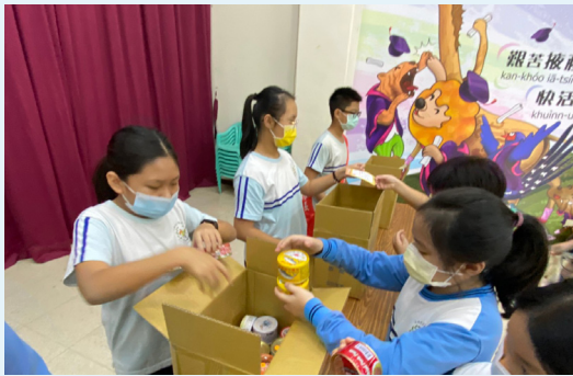
引進安德烈食物銀行：集食行善，幸福一日捐，從「剩食」、「聖食」到「集時」