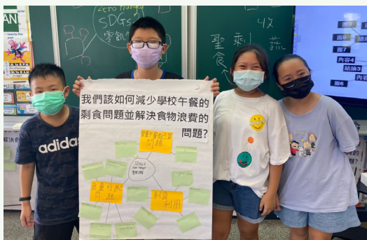
生利用心智圖分析營養午餐的剩食成因