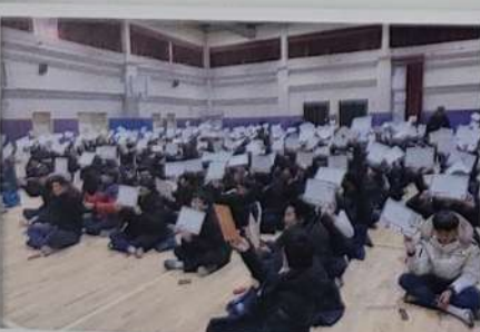
향토 골든벨 대회