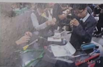
과학의 날 행사