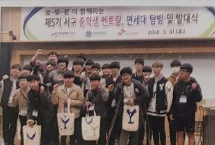
연세대 학습 멘토링