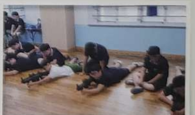
자유학기제 - 나도 명사수