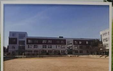
새롭게 단장한 학교 모습