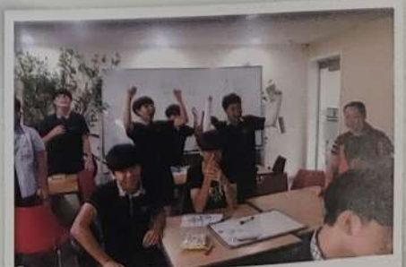
도서관 활용 수업