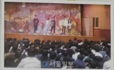
서울일본 성인지 감수성 교육