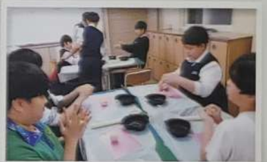
자유학기제 - 요리수업