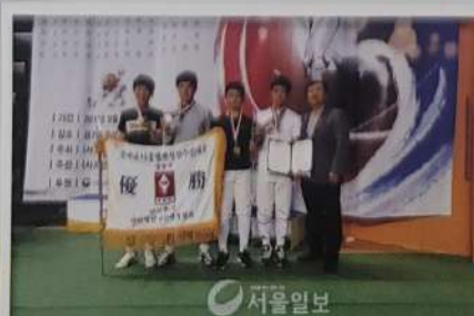
펜싱부 동메달 수상