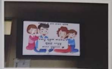
효 문자 보내기