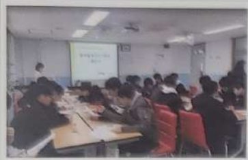
영어교육 중심 학교