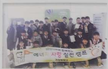
미래 에너지 학교