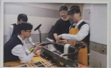
자유학기제 - 목공