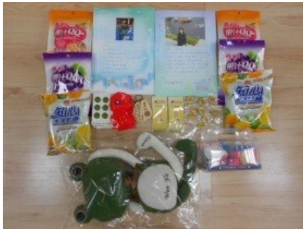
寄出我們的自我介紹卡和小小禮物