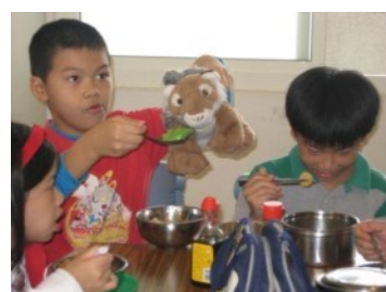
帶著Woody一起吃營養午餐