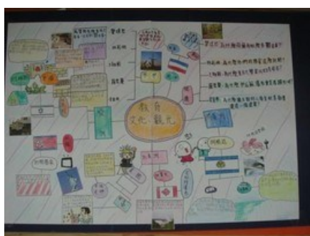
世界大不同心智圖