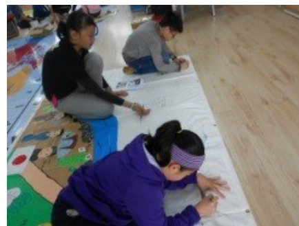
依據約定，先進行剩下的半幅壁畫草稿