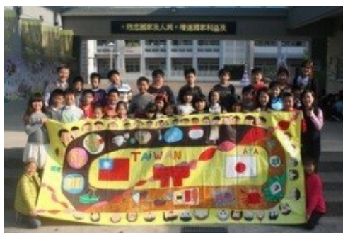
壁畫送回日本前，全班一起與壁畫留影