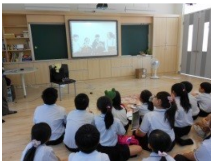
透過視訊，台日雙方一起討論壁畫的主題