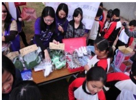
熱心的志工媽媽一同協助義賣