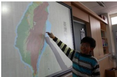
透過科技輔助，探究臺灣自然特色