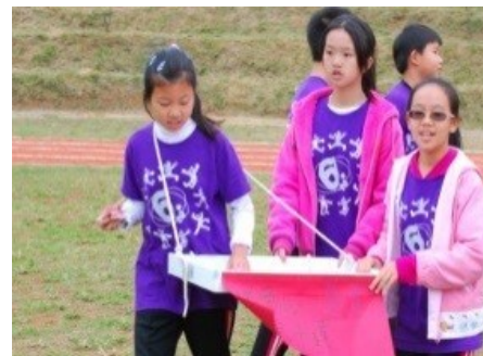
一起義賣，資助烏干達夥伴學校