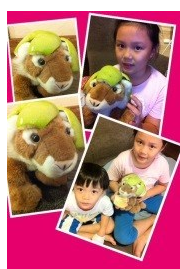
帶著Woody一起過中秋節