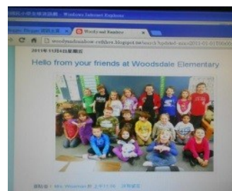
設個部落格，讓交流訊息零時差