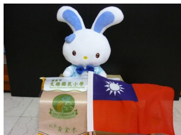
文雅小兔大使， 藍寶(Rainbow)準備出國去