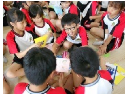
一起開心閱讀日本夥伴寄來的問候卡片