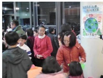
嘉義基督教醫院提供場地， 和我們一起協助烏干達