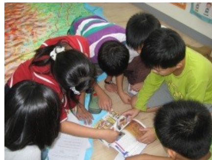
一起研究，饑荒是怎麼回事