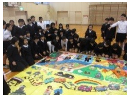
日本同學們欣賞完成後的壁畫