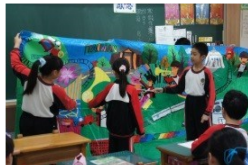
全班一起回顧整幅壁畫的內容