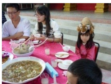
帶Woody去吃臺灣的「辦桌」