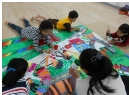
全班協力完成壁畫全圖