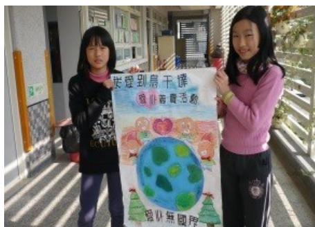
畫張宣傳海報，吸引更多人來關心饑荒