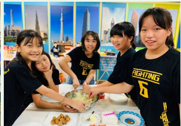
學習製作馬鈴薯泥