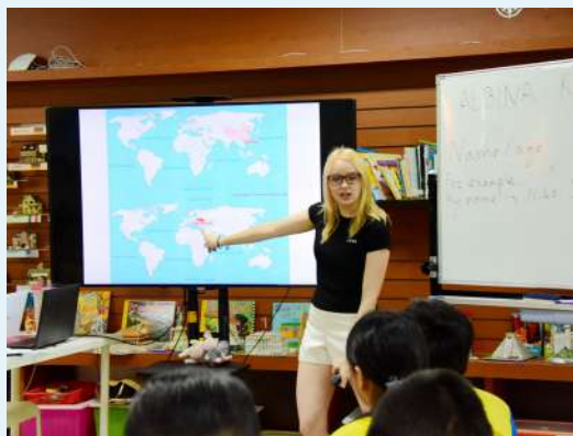
老師介紹實用馬鈴薯的國家。