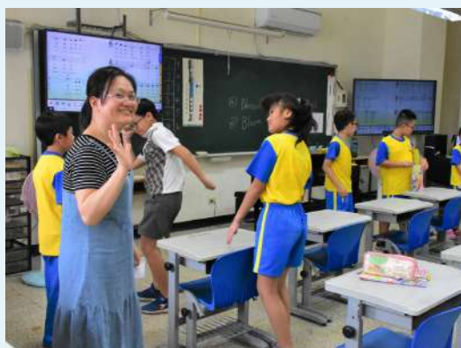
音樂課討論音樂類型