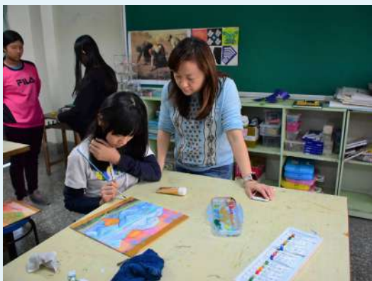
聽音樂畫出感覺來