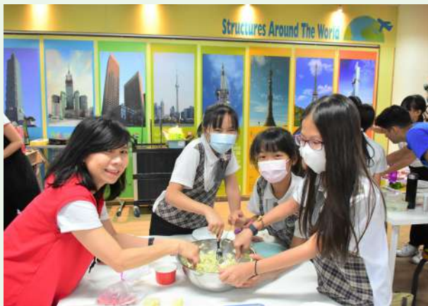
學習製作馬鈴薯泥