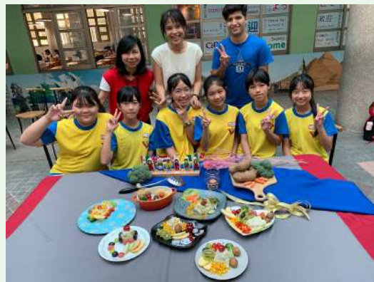
學生作品餐點擺飾