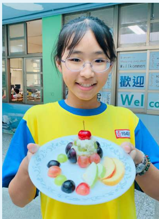
馬鈴薯餐點和擺飾