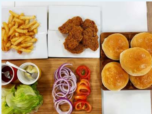
薯條製作及其他配料