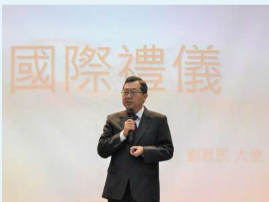
禮賓司司長到校分享國際禮儀。