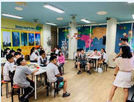
老師介紹實用馬鈴薯的國家。